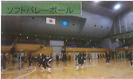
ソフトバレーボール

平成30年2月24日に行われたニュースポーツフェスティバルでは、ソフトバレーボールチームも昨年より参加が多く、会場は終始選手の声や応援の大きな声援が飛び交い大いに盛り上がりました。また、ニュースポーツ体験コーナーでも「スポレック・ペタンク・ドッチビー」など子供から大人まで、それぞれのスポーツに挑戦し楽しそうでした。「体験された方から楽しかった～有難うございました。」などと声をかけてもらいました。来年もまた、ニュースポーツ大会を開催しますので是非参加してください。