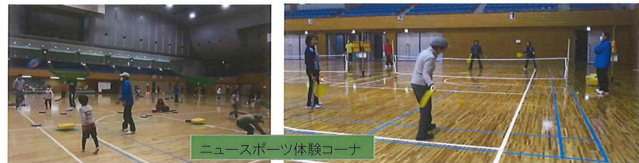
ニュースポーツ体験コーナー

九州地区スポーツ推進委員研究大会 宮崎大会 平成30年1月20日(土)～21日(日)