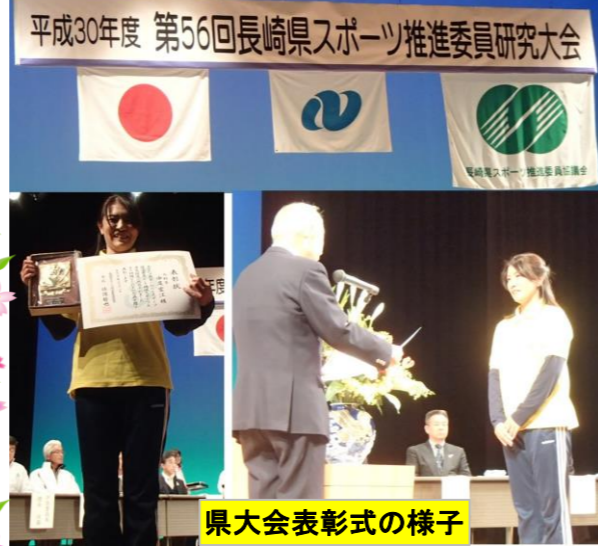
県大会表彰式の様子